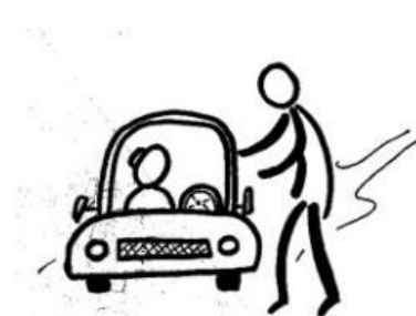
Transport de personnes