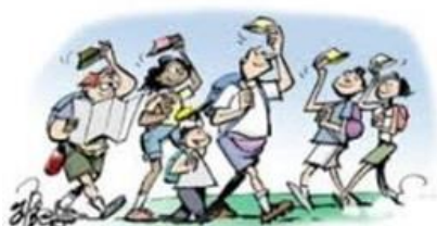
Groupe de marche